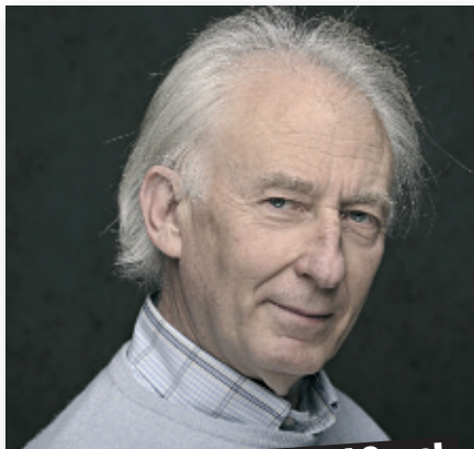
Dirige los Teatros del Canal y "El Nacional"