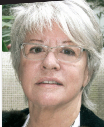
Dirige "Las cinco advertencias de Satanás"

"COMO DIRECTORA ME GUSTA QUE LOS ESPECTADORES NO NOTEN QUE EXISTE UN DIRECTOR, QUE CREAN QUE LOS ACTORES ACTÚAN POR SU CUENTA"